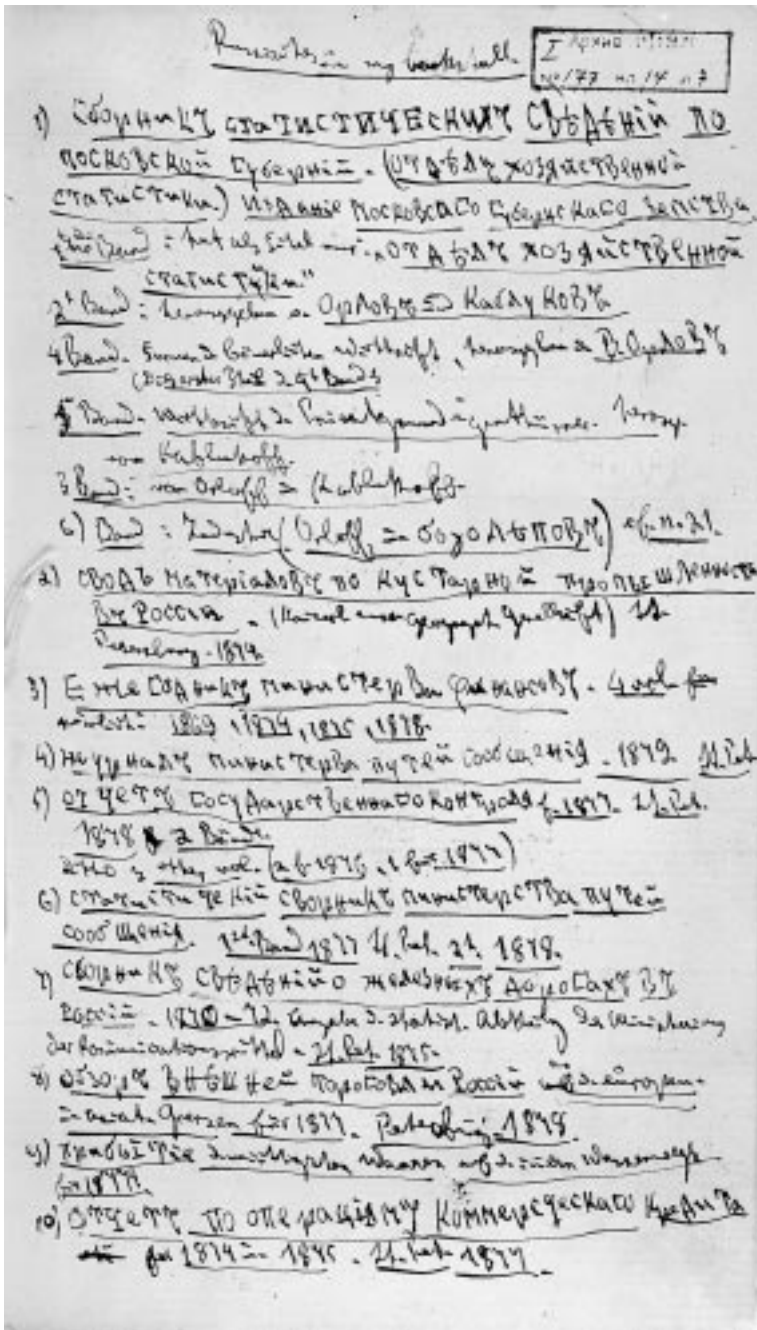
Karl Marx: Russisches in my bookstall. Verzeichnis der in seiner Bibliothek befindlichen Russica (1881/1882). Erste Seite