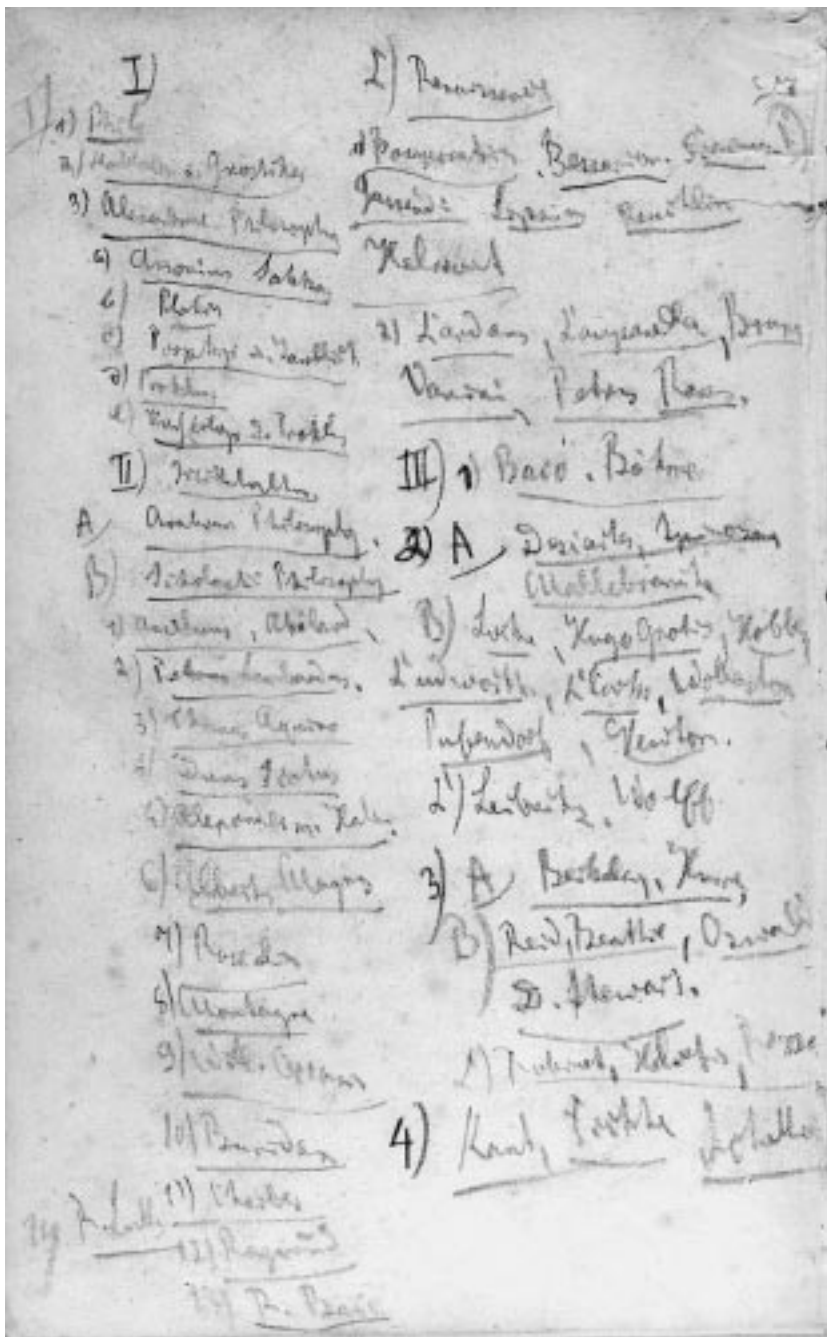
Nr. 551 Hegel, Georg Wilhelm Friedrich: Vorlesungen über die Geschichte der Philosophie. (Werke. Vollst. Ausg., 2. Aufl.) Marginalien von Marx im Band 15 auf dem hinteren Vorsatz